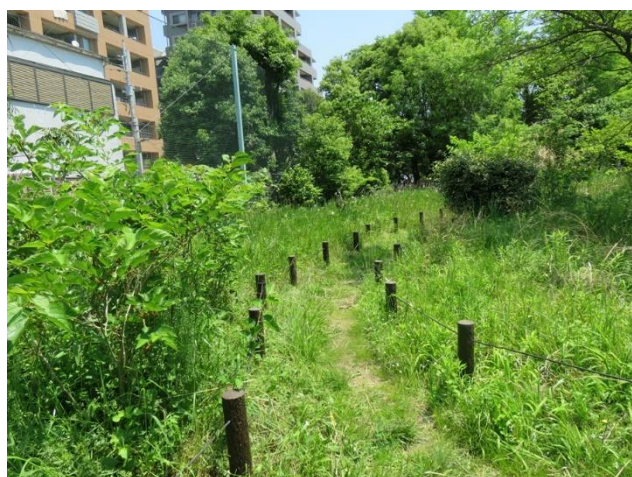
仙台堀川公園ポケットエコスペースの風景