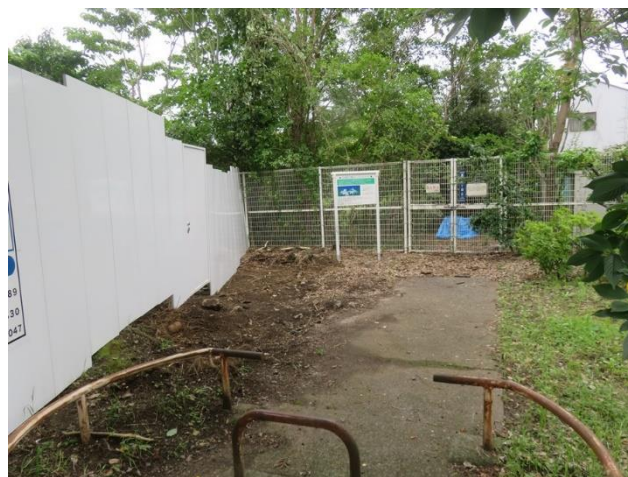
仙台堀川公園ポケットエコスペースの入口写真 入口前が集合場所