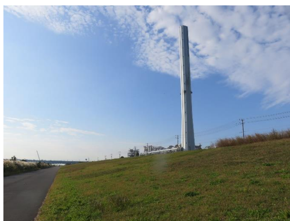
荒川下流ポケットエコスペースの集合場所（入口）の反対（土手）側写真（白い煙突から約 180m 手前）