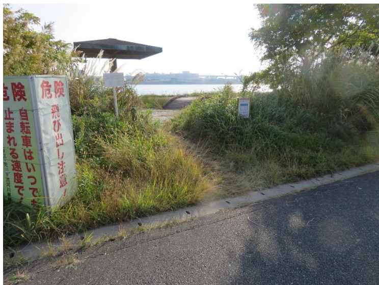
集合場所としている荒川下流ポケットエコスペースの入口の写真 手前の「危険」の看板が目印